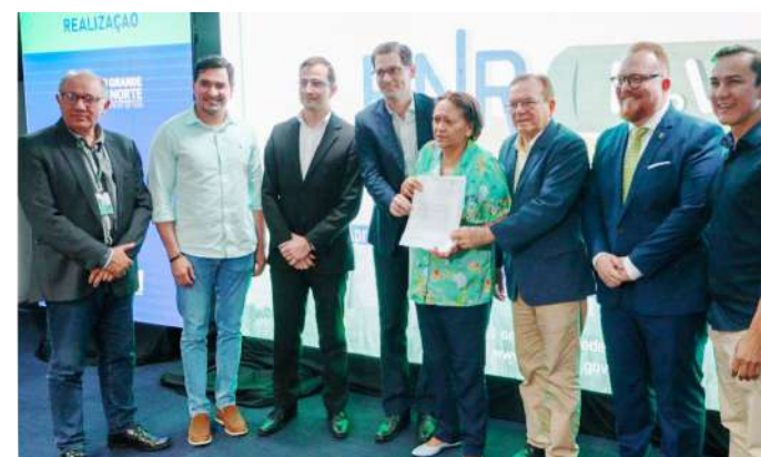
O evento reuniu parlamentares, representantes de instituições públicas e privadas.

Para a governadora Fátima Bezerra, a ocasião representa um momento histórico para o estado. “É um momento de imensa felicidade. É preciso falar do empenho do governo, que em parceria com a universidade, com a federação das indústrias e empresas da iniciativa privada, apresenta hoje este projeto. Um marco para o Rio Grande do Norte. Um projeto consistente, robusto e que se conecta com