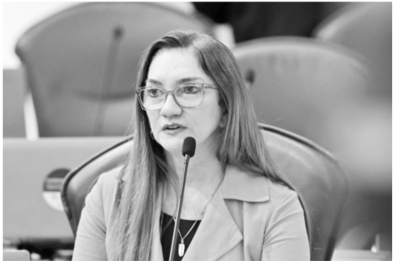
Deputada Estadual Terezinha Maia

Em pronunciamento na Assembleia Legislativa, durante sessão plenária, a deputada Terezinha Maia (PL) reforçou a sua atuação parlamentar em favor da saúde pública, educação e mobilidade urbana, destacando, na ocasião, requerimento encaminhado ao Governo do Estado com pauta sobre o transporte público da Região Metropolitana de Natal.