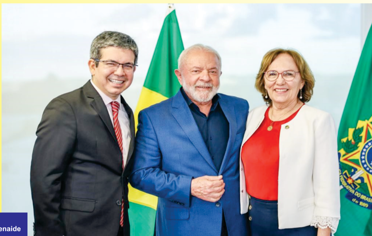
FOTO: Senador Randolfe Rodrigues, Presidente Lula e a Senadora Zenaide

“O diálogo com o Congresso é fundamental para aprovar, por exemplo, a reforma tributária, que é uma das prioridades do governo Lula para retomar o desenvolvimento do nosso país”, afirmou Zenaide.