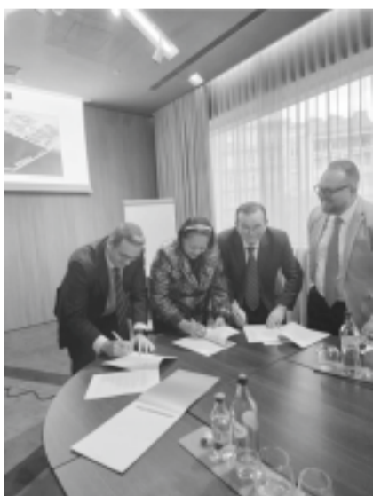
Assinatura de memorando de entendimento com a empresa Enerfin

Diretores da Enerfin também participaram da reunião de Lisboa. A empresa já investe no RN e durante a reunião os gestores gostaram do que ouviram da comitiva potiguar, uma vez que ficou clara a real inten-