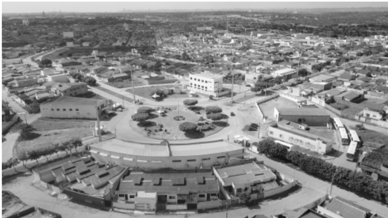
Bairro dos Jardins - São Gonçalo do Amarante

de maior concentração populacional do município, continua