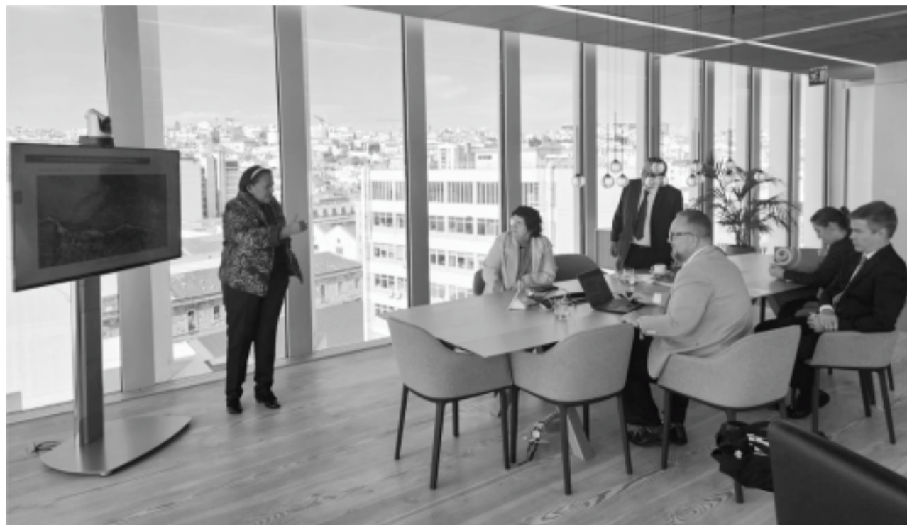
Governadora Fátima fazendo apresentação do Porto-Indústria Verde em Lisboa

Para o secretário Jaime Calado, o Rio Grande do Norte é um “case” mundial de sucesso, graças aos esforços da governadora Fátima e a equipe da Sedec. “Tratativas no exterior como estas aqui em Portugal permitiram que em 2022 o Governo do RN atraísse mais de R$31 bilhões em investimentos. Isso chega nas pessoas através do emprego. Só o setor de energia solar distribuída (em residências e empresas) está gerando, atualmente, 10.497 empregos; sem falar na energia solar centralizada (produzida