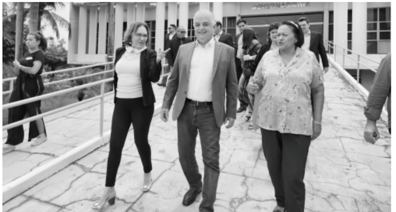
Senadora Zenaide, ministro Márcio França e governadora Fátima descendo a rampa da Governadoria para visita técnica ao Aeroporto Internacional de São Gonçalo

gico e viável. Nada mais justo que ele seja construído aqui no Rio Grande do Norte, que é o maior produtor de energia eólica do país. O ministro também mostrou que o empreendimento não precisa ter a concorrência apenas de empresas internacionais, que a Petrobras pode perfeitamente investir nesse porto, até porque já criou uma diretoria e vai passar a investir em energia verde”, defendeu Zenaide.