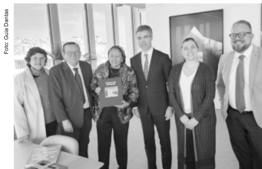
Comitiva do RN com executivos da EDP Renováveis

2020 – MAIS DE R$ 7 BILHÕES 2021 – MAIS DE R$ 13 BILHÕES 2022 – MAIS DE R$ 31 BILHÕES